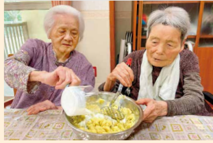
秋フロア (おやつ作り)