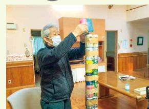
缶積み (レクリエーション)