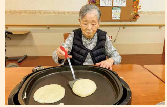
冬フロア (お菓子作り)