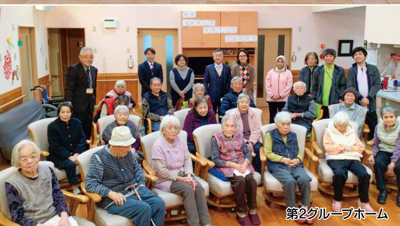
第2グループホーム