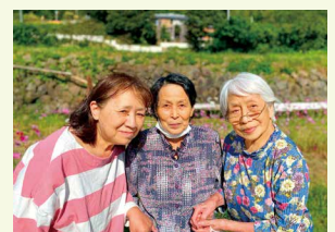
コスモスを見に外出 (ドライブ)