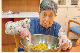
夏フロア (おやつ作り)