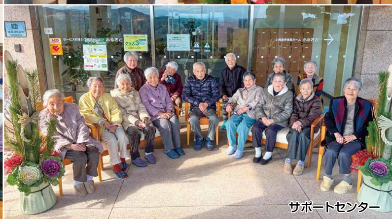
サポートセンター