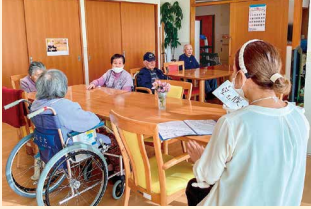
春フロア (レクリエーション)