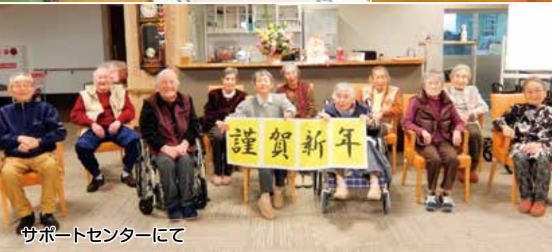
サポートセンターにて