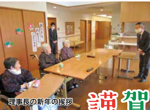
理事長の新年の挨拶