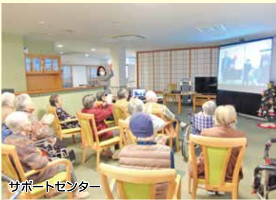
サポートセンター