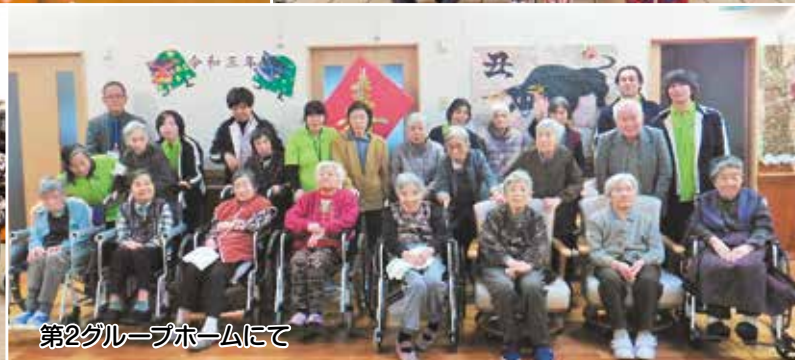
第2グループホームにて