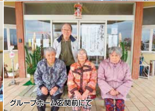
グループホーム玄関前にて