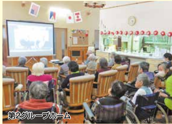
第2グループホーム