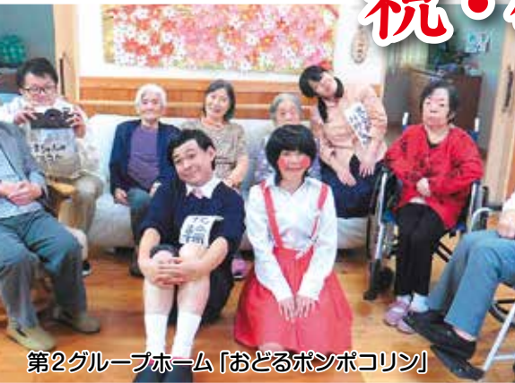
第2グループホーム「おどるポンポコリン」