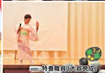
特養職員「大器晩成」