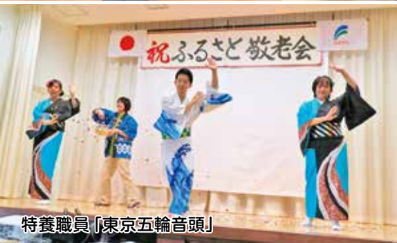
特養職員「東京五輪音頭」