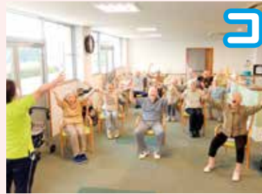
笑いヨガで免疫力アップ!!

“コロナに負けるな!”を合言葉に、屋内生活が多くなってしまふ皆さんの、免疫力向上や体力維持に効果的と考えられる活動を行っています。