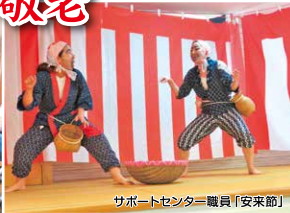
サポートセンター職員「安来節」