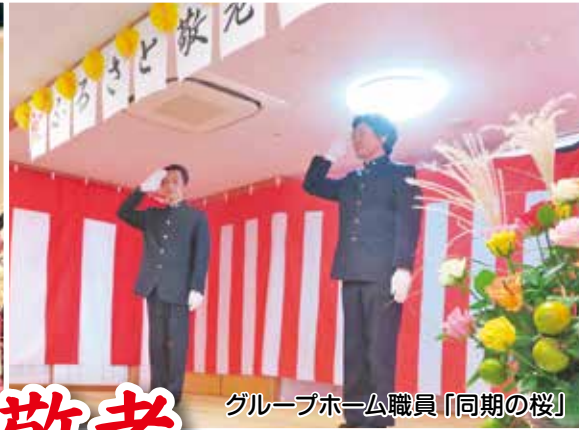
グループホーム職員「同期の桜」