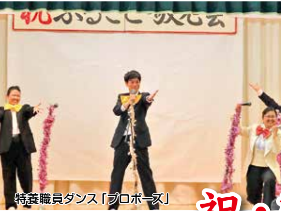
特養職員ダンス「プロポーズ」