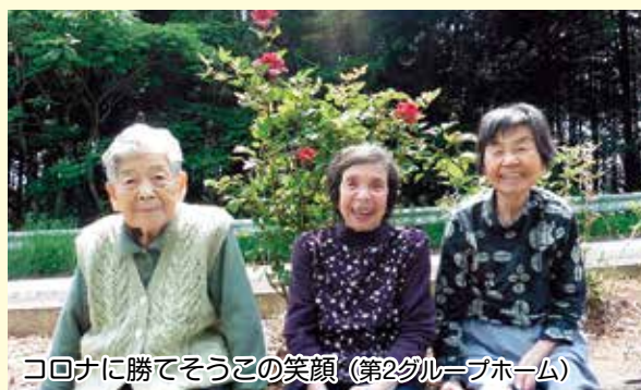
コロナに勝てそうこの笑顔 (第2グループホーム)