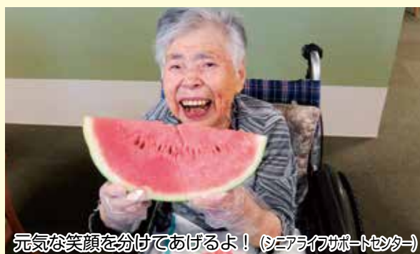
元気な笑顔を分けてあげるよ! (シニアライフサポートセンター)