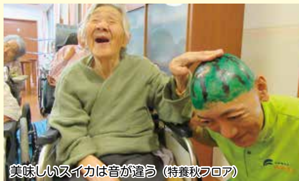
美味しいスイカは音が違う (特養秋フロア)