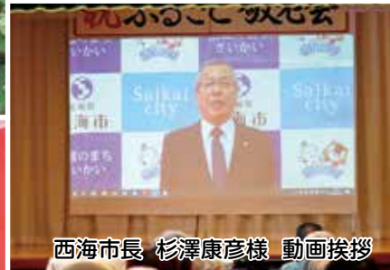
西海市長 杉澤康彦様 動画挨拶