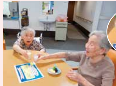
ドリンクバーでおいしく水分補給