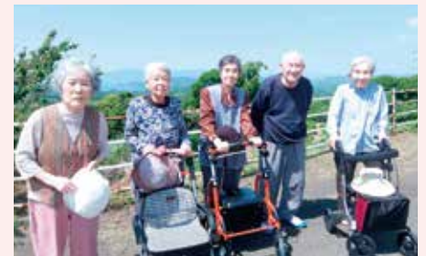
外気浴で骨を強く!