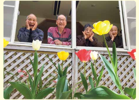
「笑顔の花が咲く」 (グループホーム すずらん棟)