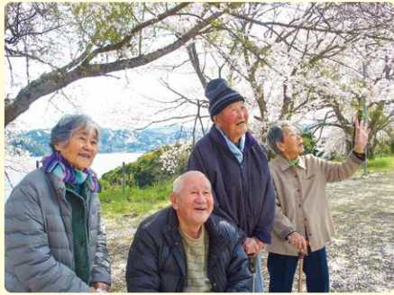
「冬が過ぎて春、みんなに会いたいなあ〜」 (サポートセンター)