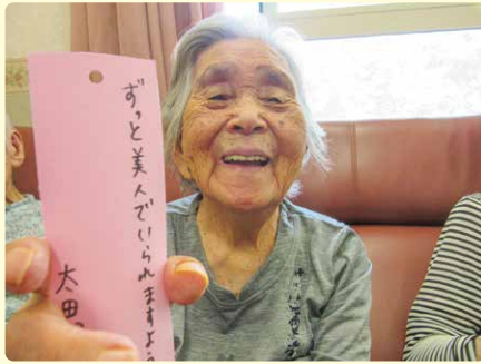
「女性は生涯美人」 (特養 冬フロア)