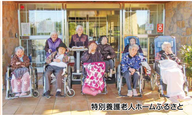
特別養護老人ホームふるさと