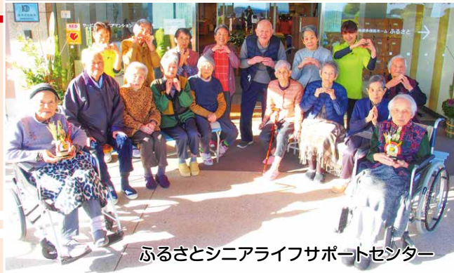
ふるさとシニアライフサポートセンター