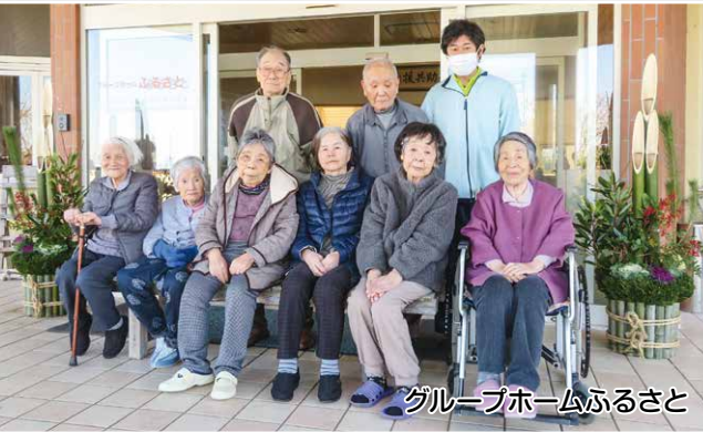
グループホームふるさと