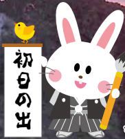
令和5年元旦サポートセンターより撮影