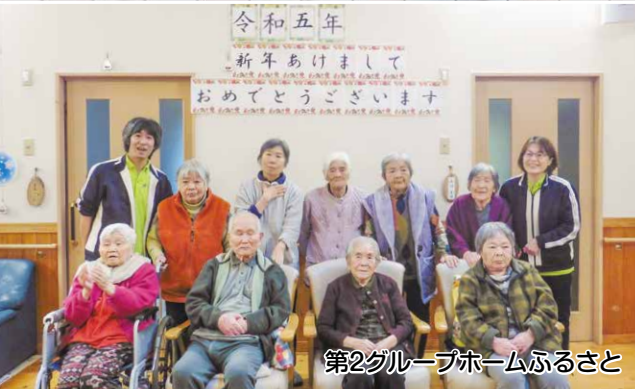
第2グループホームふるさと