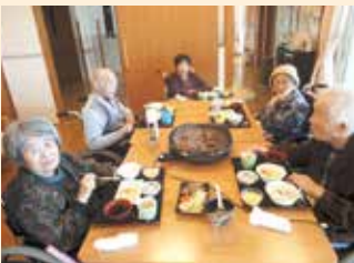
ステーキを食べました！