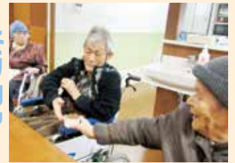
バレンタインデー