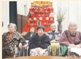
ひな人形の前で記念撮影