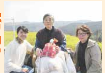
菜の花畑がきれいやね～