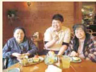
お菓子の「いわした」までケーキを食べに出かけました！