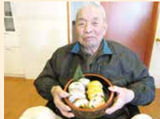
美味しそうな巻き寿司です