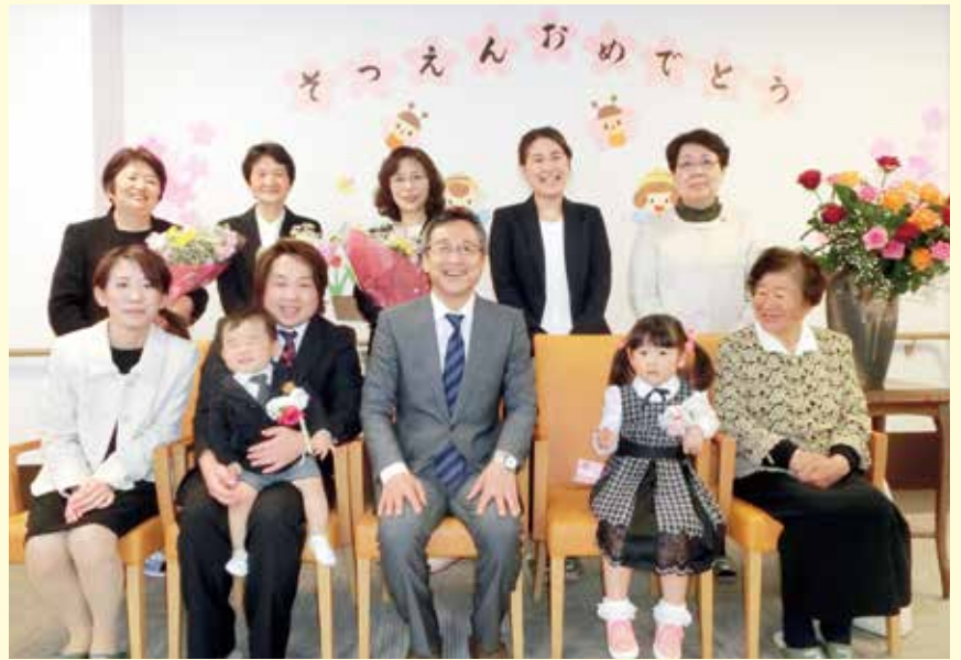
みんなで記念撮影