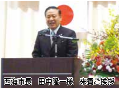
西海市長 田中隆一様 来賓ご挨拶