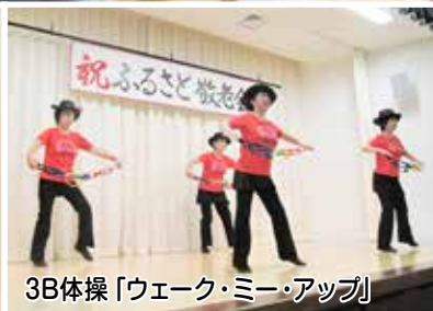
3B体操「ウエーク・ミー・アップ」