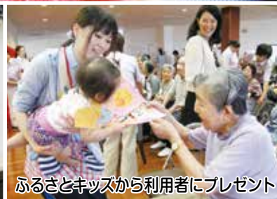
ふるさとキッズから利用者にプレゼント