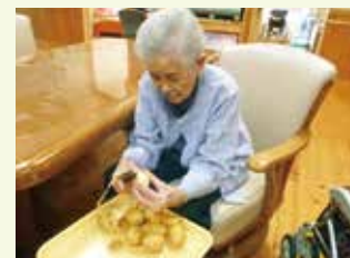
じゃがいもの皮むき